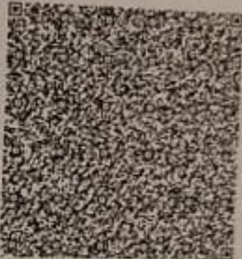
QR Code with Photograph

Signature Not Verified Digital Signature AUTHORITY CERTIFICATION Date: 03/12/2018 01